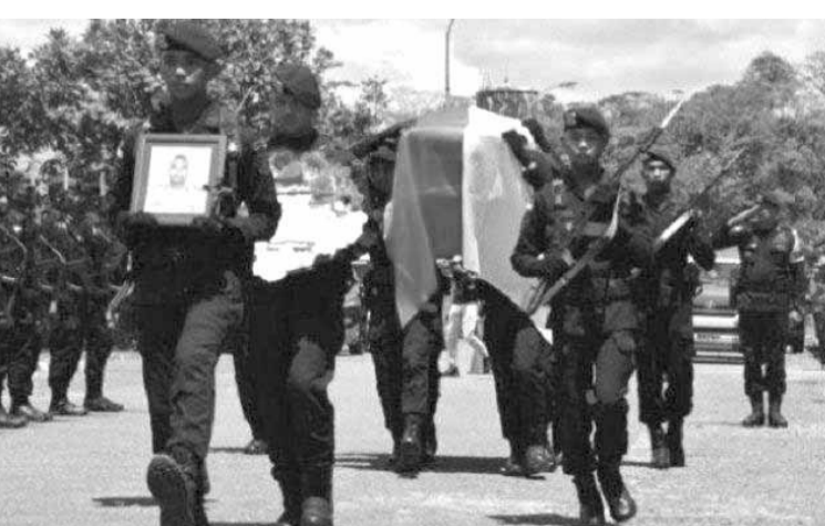
又有两名国军士兵在恩杜加遭遇巴布亚武装犯罪团伙袭击丧生。

生。目前，这两名阵亡士兵一等兵 S(Pratu S)和二等兵 P(Prada P)也已被疏散，仍在等待航班的时间表。 11 月 25 日，在恩杜加县巴罗区与巴布亚武装犯罪团伙发生枪战后，四名陆军后备战略指挥部士兵不幸阵亡。 (亮剑)