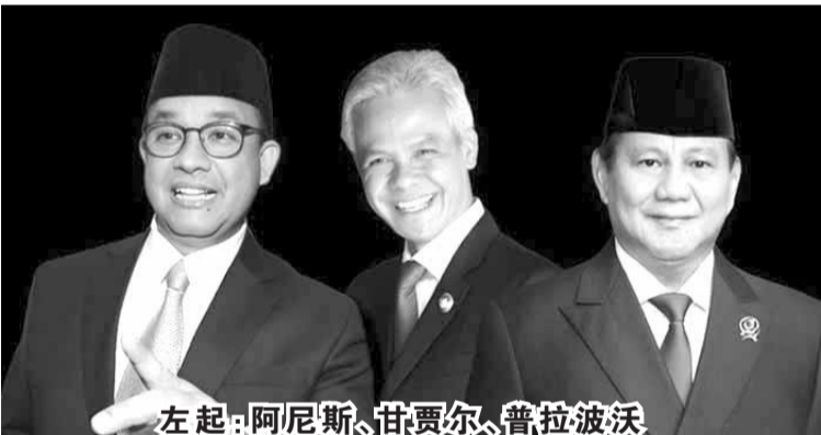
左起：阿尼斯、甘贾尔、普拉波沃

定了 2024 年总统选举的总统与副总统候选人辩论的时间表。首场辩论将于 12 月 12 日举行。辩论会将在全国的电视台播出，总时长为 150 分钟。辩论部分的细分为 120 分钟，其余部分为商业广告。 普委会第 15/2023 号条例第 50 条第(1)款规定，总统候选人和副总统候选人将举行三次辩论。但是，普委会仍然可以与国会协调进行更改。 2024 年总统选举的三队候选人已经确定了，即阿尼斯-穆海敏、甘贾尔-马福和普拉波沃-吉布兰。 (亮剑)