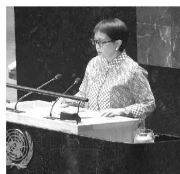
外交部长蕾特诺在联合国大会上表明我国严正立场

致力于增加援助，包括准备派遣医院船。”她继续说道。 然后，是公正的重要性。蕾特诺说：“我提醒大家，在战争中同样有规则和限制。在加沙，我们没有看到这两种原则的存在。对各种民用设施的袭击非同寻常。我再次强调，这不是正常的事情。在加沙发生的是对国际人道法的侵犯。” 蕾特诺强调，必须停止双重标准的应用，并且印度尼西亚支持寻求以色列承担责任的努力，包括向国际法院起诉以色列军方严重侵犯基本人权的暴行。 第四步是重新启动政治与和平进程的重要性。蕾特诺认为，必须解决以巴冲突的根本问题，即以以色列对巴勒斯坦的非法占领。印度尼西亚还推动巴勒斯坦获得联合国的完全