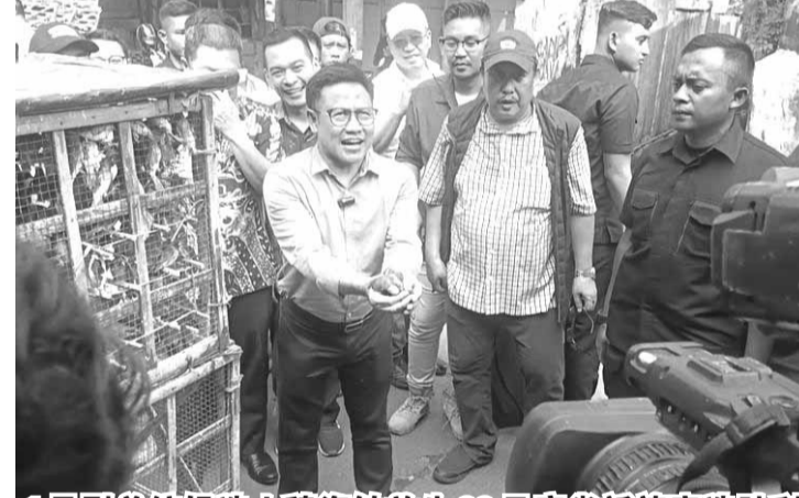
1号副总统候选人穆海敏放生99只麻雀祈祷竞选胜利

【本报讯】11 月 30 日，1 号副总统候选人穆海敏在走访雅加达西区北德森美兰，草埔时，买下 99 只麻雀放生，并许了一个愿。 穆海敏表示，我放生了鸟儿 99 只麻雀，祈祷阿尼斯-穆海敏在大选中获胜。 在走访期间，穆海敏由民族复兴党中央理事主席丹尼尔·约翰(Daniel Johan)陪同。穆海敏委托丹尼尔买些乌龟，并交在海里放生。 穆海敏声称，放生乌龟和鸟类是华人的传统，必须保持下去。我还让丹尼尔买些乌龟，写上我的名字，把乌龟在海上放生。这些都是华人的传统，我们也将保留下去。 穆海敏放生的麻雀每头 1200 盾，在放生这些麻雀之前，穆海敏还顺道购买了 5 公斤牛油果，总价为 20 万盾。 穆海敏声称，牛油果是其最爱，除了是身体有益脂肪的来源外，牛油果