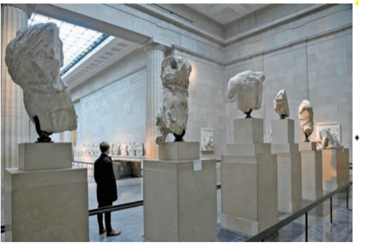
大英博物館內的希臘帕特農神廟大理石雕塑。

【香港商報訊】當地時間27日，希臘總理發言人表示，希臘總理米佐塔基斯原定於27日與英國首相辛偉誠的會晤「在最後時刻」被取消，他對此表示失望。英國政府方面確認了會晤取消。