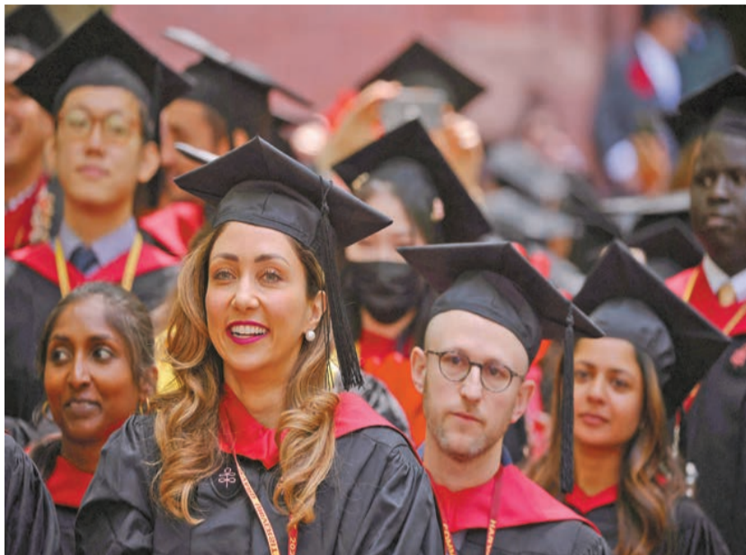
美國千禧世代認為年薪需要達到52.5萬美元才能感到幸福。

哥倫比亞大學商學院經濟學教授豪斯表示，由於商品和服務價格高企以及利率高企，許多家庭的財務狀況捉襟見肘。