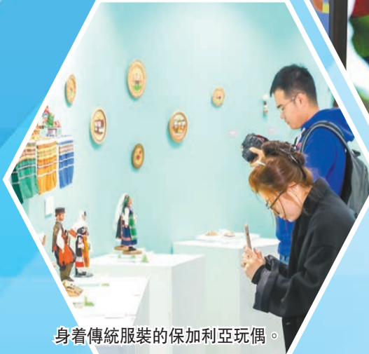
身穿傳統服裝的保加利亞玩偶。