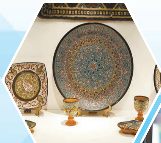
烏茲別克斯坦的瓷器。

「一包難求」的佛羅倫薩「老奶奶」手工包，享有「透明的黃金」美譽的捷克水晶，意大利品牌ALESSI「外星人」榨汁機模型，更有絲路·拾年——「一帶一路」匠心視界文創成果展中的特色展品都成為了熱門打卡點……實實在在為大眾呈現了一場前所未有的國際文化盛宴。