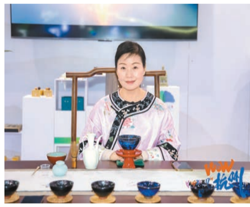
臨安館中的天目盞展台