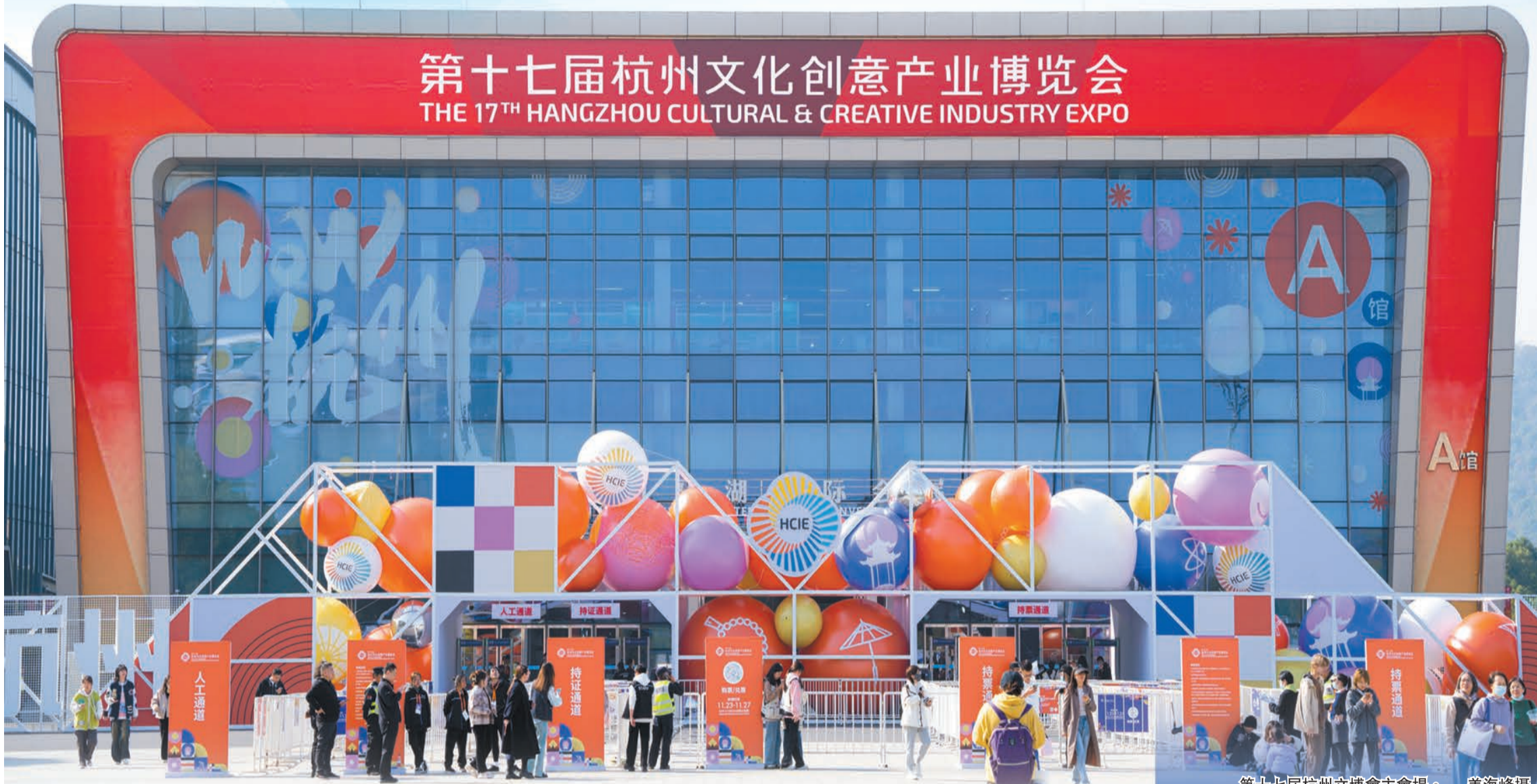
第十七屆杭州文博會主會場。

第十七屆杭州文化創意產業博覽會 THE 17TH HANGZHOU CULTURAL & CREATIVE INDUSTRY EXPO