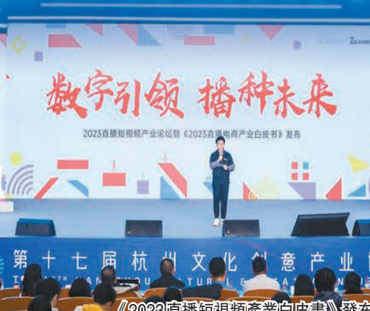
《2023直播短視頻產業白皮書》發布

本屆文博會着力賦能產業發展、拉動文化消費，助推人文經濟繁榮興盛。展會期間舉辦多場項目簽約，評選公布「2023年度十大文創新勢力」「2023杭州文創新雲榜」等新一批文創新銳企業，集中展現充滿奇思妙想的潮流藝術品和數字文化場景，有效激發文化產業發展新活力。廣大觀眾不僅參觀打卡，也主動消費，一大批國內外精品文創受到熱捧、持續熱銷，在杭州迅速形成現象級文化消費熱點。