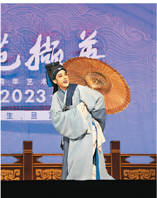
越剧《珍珠塔·惊塔》剧照。