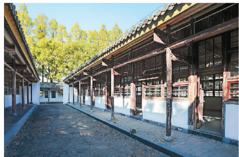
敬敷书院旧址高舍。

单霁翔说，在今天的文化城市建设过程中，想要把文化遗产保护好，不仅需要妥善保护其本身，更需要把它们的文化意义、文化价值挖掘出来，把接近人们现实生活的部分加以呵护、维护和保护，这样才能“让文化遗产更好地融入生活”。