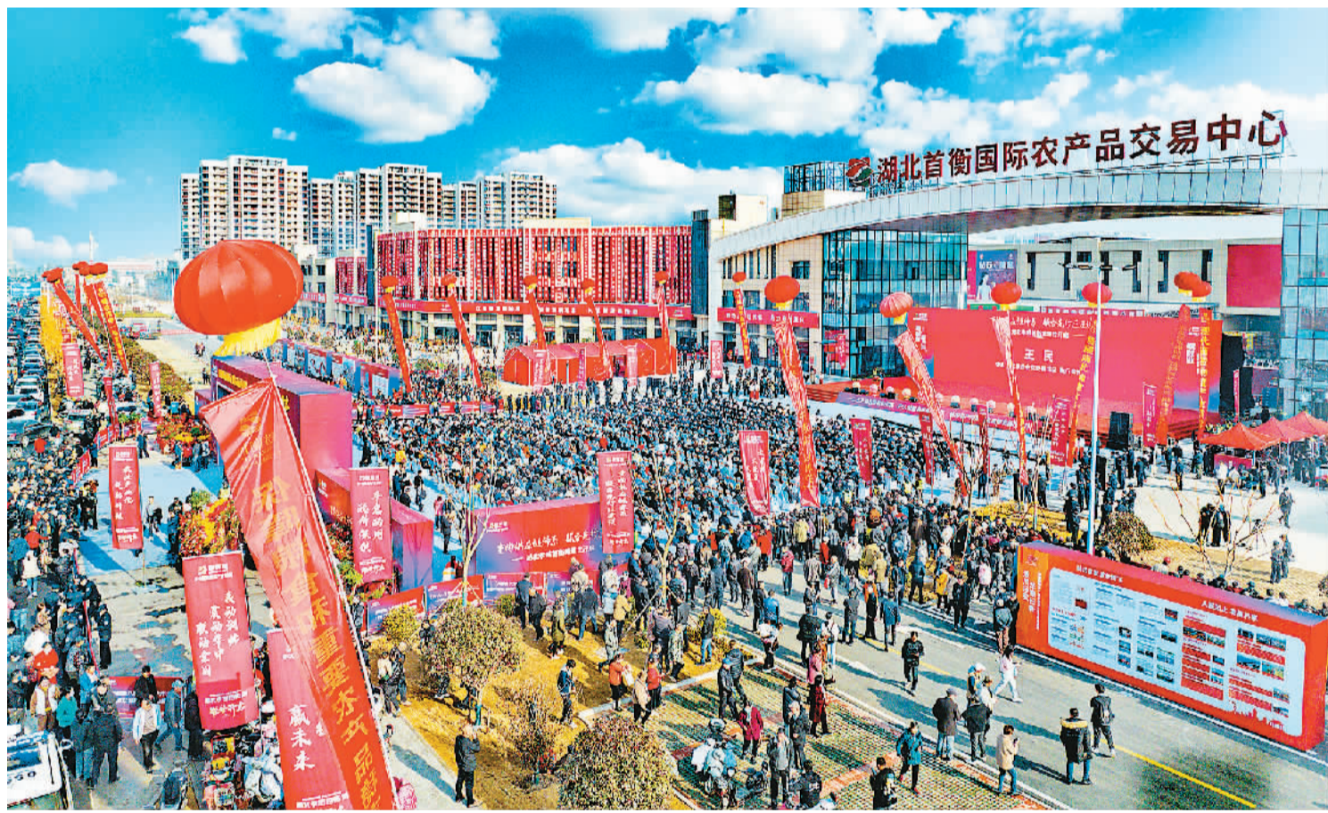
11月28日，华中地区最大农产品供应链平台在湖北孝感首衡城启动运营。当天，蔬菜、水果、冻品和淡水鱼四个业态同步开业，3000多家商户同时开业，到场采购商2600多家，农产品进场4.2万吨，交易2万吨，交易额1.7亿元。据测算，孝感首衡城项目投入运营后，仅在当地就可提供3万个就业岗位，每年拉动消费20亿元以上。图为项目开业现场。

本报北京11月28日电（记者冉永平、丁怡婷）记者从国家电投获悉：近日，我国首个跨地级市核能供热工程——国家电投“暖核一号”三期核能供热项目在山东投运，在给烟台海阳市供暖的同时，供暖区域到达威海乳山市，实现零碳热源的跨区域互通共享。该工程可覆盖乳山主城区630万平方米，预计可替代原煤消耗23万吨、减排二氧化碳42万吨。 “暖核一号”一期项目于2019年建成，成为我国首个核能供热工程；二期项目2021年投运，使海阳市成为我国首个“零碳”供暖城市；今年的三期项目首次实现了核能供热的跨地级市发展。本供暖季“暖核一号”供暖面积合计达1250万平方米，可满足约40万人口的冬季清洁取暖需求。