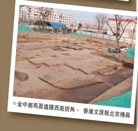
◆金中都馬面遺蹟西南拐角。