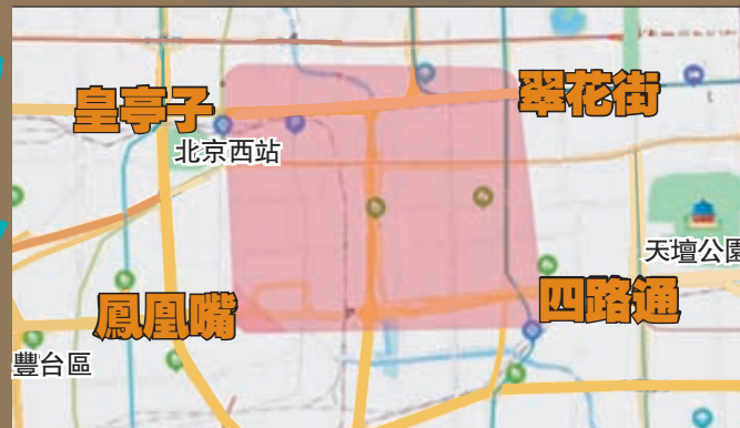
金中都遺址地理位置