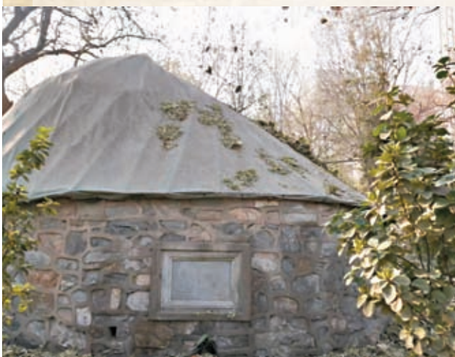
◆金中都城遺蹟。