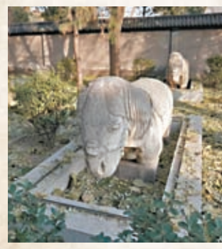
◆金中都城遺蹟附近的文物。

香港文匯報訊（記者 馬曉芳 北京報道）北京建都870周年國際學術研討會25日在京舉辦，多位專家現場分享了金中都遺址發掘的最新進展。專家們認為，金中都遺址發掘出的金中都外城牆、馬面、護城河、順城街道路等為認識北京城市變遷提供依據，實證了北京從城到都的轉變。金中都城遺址公園對外開放2.6公頃，將文物展示、文化傳承與現代生活融合，全民共享文物保護成果。在金中都城遺蹟鳳凰嘴，專家們感嘆「一眼八百年」，期待文物遺蹟被更好保護利用，讓後人現場感受中華歷史文明的源遠流長。