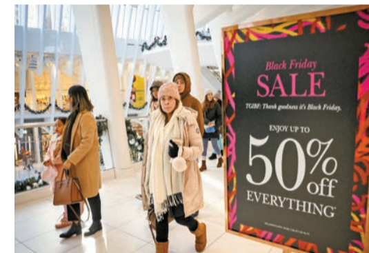
紐約百貨公司推出黑五五折大減價，以吸引顧客。

此外，潘迪亞指出，衝動購物可能對黑五在線銷售額的增長起到了一定推動作用，因為有多達53億美元的在線銷售額來自手機購物，佔比首次超過了電腦購物。他指出，那些有影響力的公眾人物和社交媒體廣告的宣傳，讓