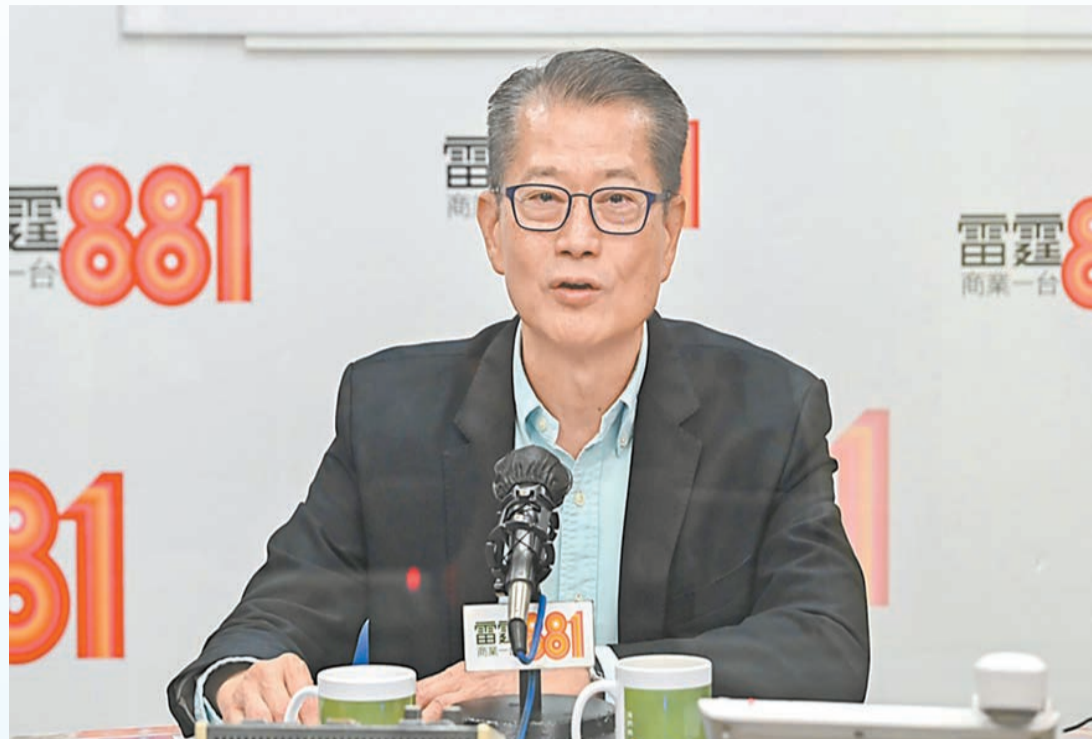
陳茂波昨日出席電台節目時表示，出席APEC期間，已有醫療健康科技公司表明有意落戶香港。

進。除重點企業外，投資推廣署今年首10個月也協助了超過330間內地或海外企業在本港開設和擴展業務，同比增長30%，這些企業預計會為香港創造超過3700個就業機會。