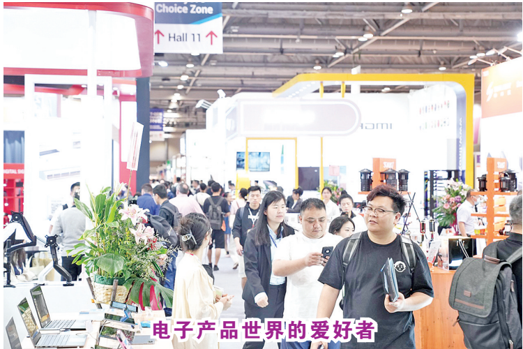
电子产品世界的爱好者

【本报讯】印尼最大电子产品商对商贸易展-印尼全球资源电子展(GSEI),将于2023年12月6-8日在雅加达会议展馆(JCC)举行。作为该展会支持伙伴之一的印尼中型企业协会,将2023年印尼全球资源电子展视为推动