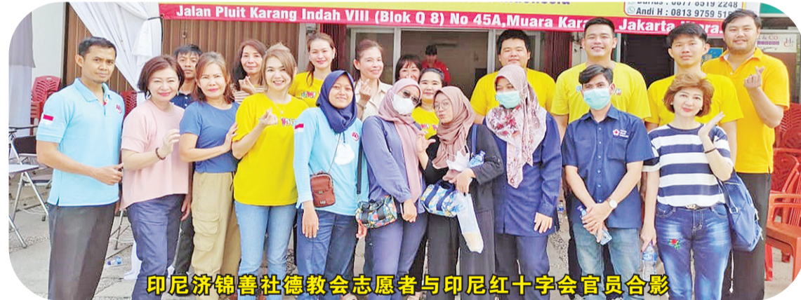
印尼济锦善社德教会志愿者与印尼红十字会官员合影