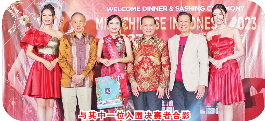
与其中一位入围决赛者合影