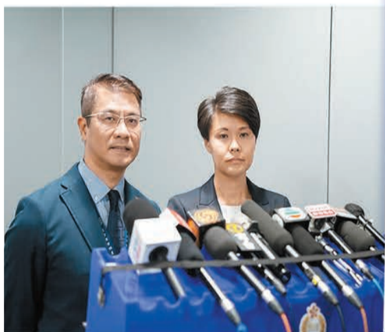
警方昨日交代虛假投資平台 Hounax 詐騙案詳情。