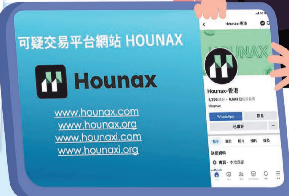
虛假投資平台 Hounax 的網站和社交平台專頁。

【香港商報訊】記者萬家成報導：繼 JPEX 詐騙案後，本港近日再爆出一宗投資詐騙案。警方昨日表示，近日發現一個名為「Hounax」的虛假投資平台，誘騙市民投資虛擬貨幣，至今接獲 88 宗報案，涉及 131 名受害人，年齡介乎 19 至 78 歲，涉款約 1.1 億元，最大一宗案涉款逾 400 萬元。警方已要求社交平台將「Hounax」下架，並將可疑超連結交予電訊商協助「封網」。據悉，此案暫時未有疑犯被捕，警方則表示，暫時看不到此案和 JPEX 案有關係，由於今次涉案的公司聲稱是新加坡公司，警方不排除會和海外機構合作調查。