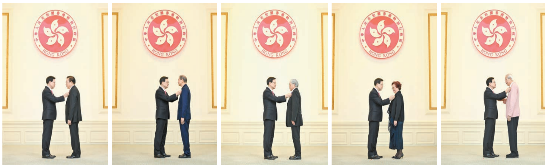
特首李家超分別向林健鋒、潘宗光、霍震霆、林淑儀、施子清（從左至右）頒授大紫荊勳章。

【香港商報訊】記者戴合聲報導：2023年度勳銜頒獎典禮昨日在香港禮賓府宴會廳以閉門形式舉行，行政長官李家超在典禮上頒授勳銜及獎狀予出席的379名受勳人士。出席的受勳人士中，5人接受大紫荊勳章，9人接受金紫荊星章；27人接受銀紫荊星章；2人接受銀英勇勳章；15人接受紀律部隊及廉政公署卓越獎章；39人接受銅紫荊星章；3人接受銅英勇勳章；42人接受紀律部隊及廉政公署榮譽獎章；86人接受榮譽勳章；68人接受行政