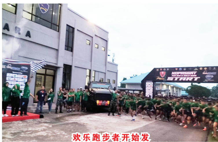
欢乐跑步者开始发