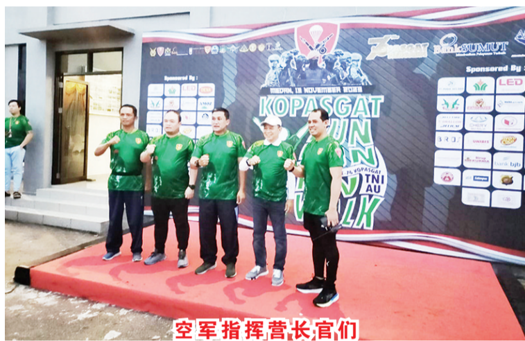
空军指挥营长官们

很高兴看到社区这次庆祝76成立周年的热情。感谢上苍,今天早上人们热忱非常高涨。他希望通过2023年运活动能移增加国军与周边社区的亲密程度。希望国军和社区之间能够团结一致,尤其是第469Kopasgat 划今后定期举办积极的最后举行龙狮呈祥,突击队营和社区之间,幸运抽奖游戏结束晨运活动。(国强报导)