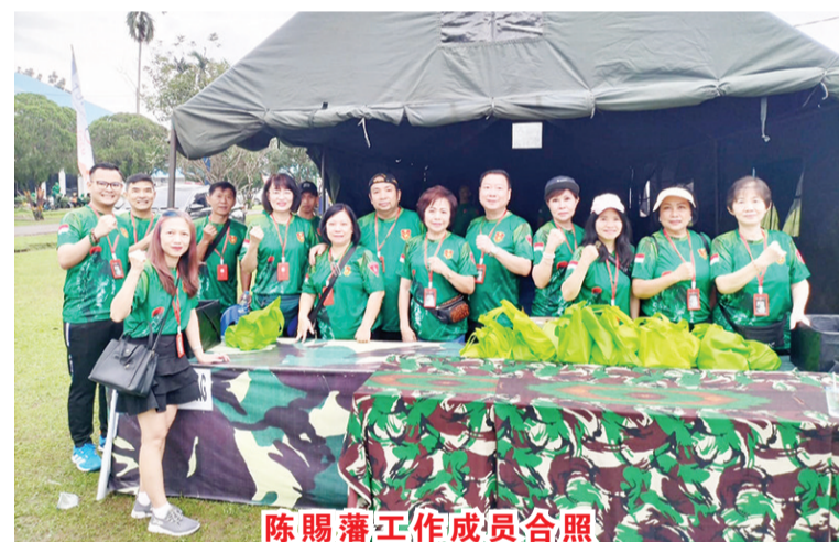
陈赐藩工作成员合照