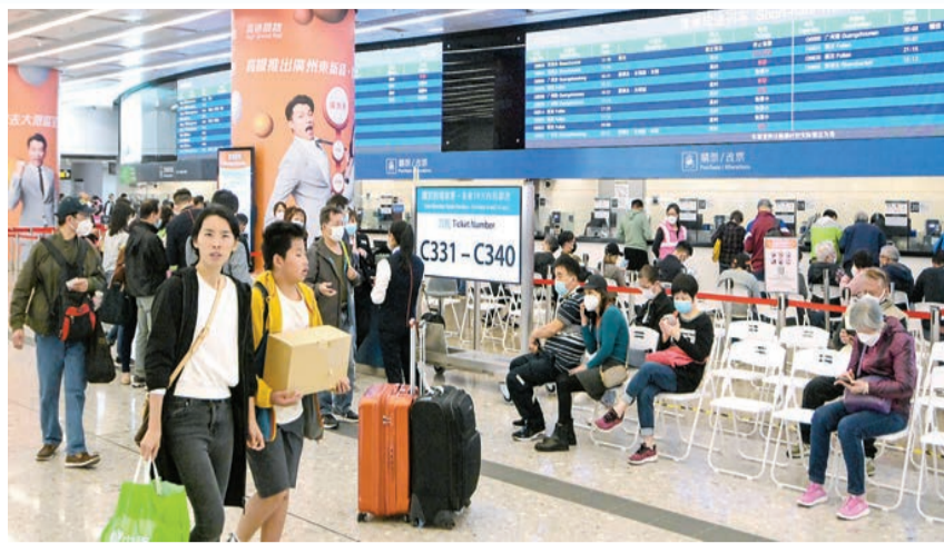
截至11月19日，今年高鐵路段載客人次已超越2019年全年，達到逾1700萬人次。

國泰表示，集團（包括國泰航空及香港快運）有望實現去年底所訂的2023年重建目標。預期12月將運作疫情前70%的客運航班，覆蓋約80個航點。為滿足疫後客運