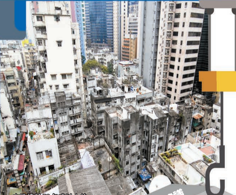
本港樓齡50年或以上的私人樓宇過去10年由4500幢增至9600幢，增幅超過一倍。