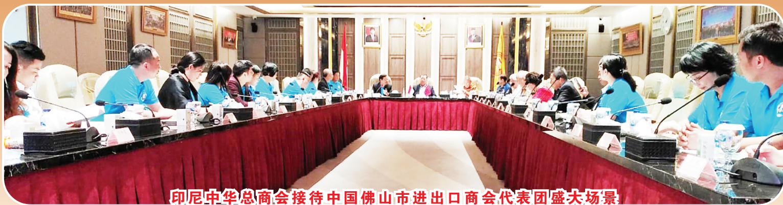
印尼中华总商会接待中国佛山市进出口商会代表团盛大场景