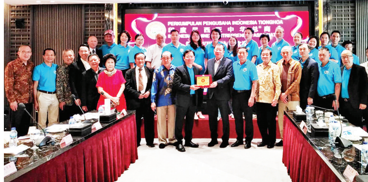
印尼中华总商会接待中国佛山市进出口商会代表团会后合影