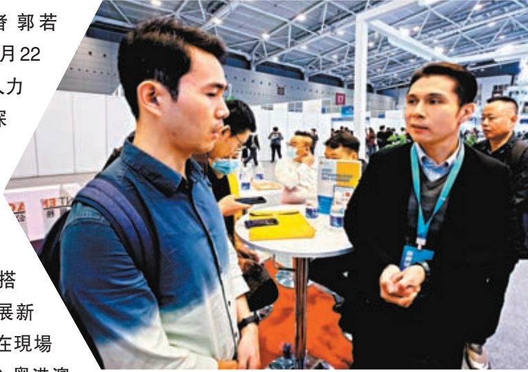
▲香港人才服務辦公室工作人員(右)現場解答求職者諮詢。

香港文匯報訊(記者郭若溪、李薇 深圳報道)11月22日至23日,第二屆全國人力資源服務業發展大會在深圳舉行。大會以「激發人力資源動能 匯聚強國建設力量」為主題,「會」「展」「賽」「聘」並舉,探討行業新趨勢,搭建供需新平台,匯聚發展新動能。香港文匯報記者在現場看到,本次大會注重融入粵港澳大灣區,有不少港澳元素,設立了粵港澳大灣區人力資源服務業發展成就展,重點內容包含對香港、澳門人才政策的展示。香港人才服務辦公室還首次獨設展位,聯合5家香港人力資源機構參展,並在現場提供了多個主題分享活動,吸引大批參會者互動提問。