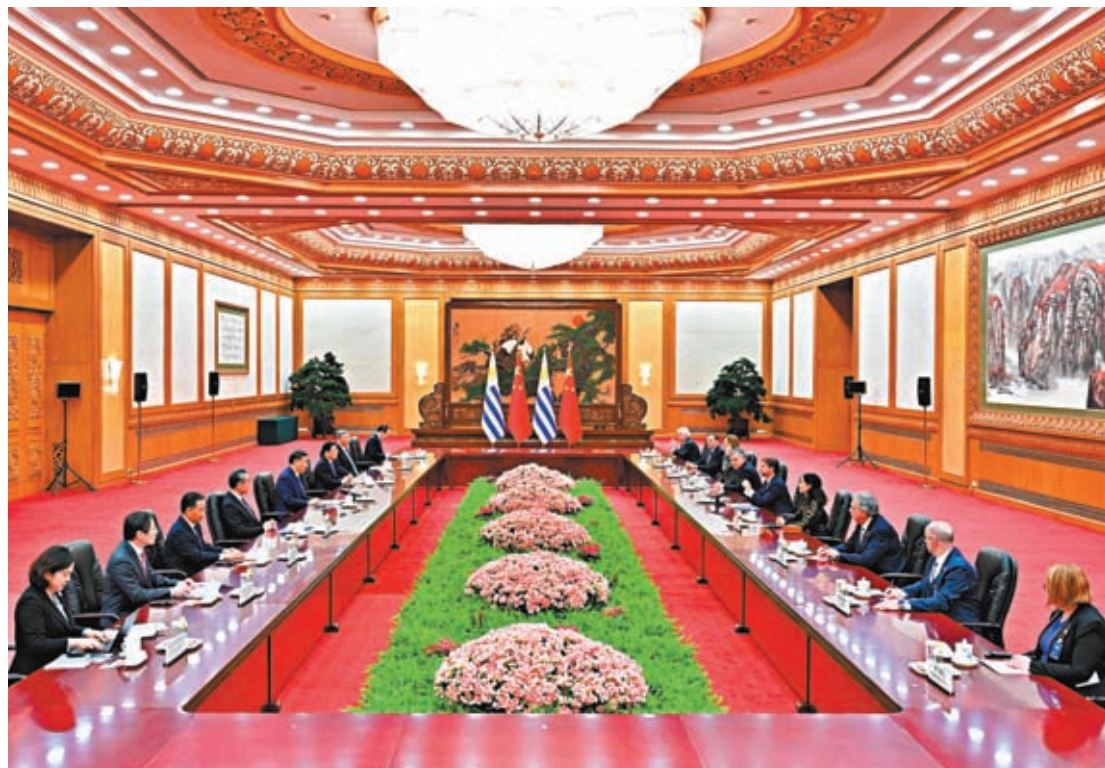
◆11月22日下午，中國國家主席習近平在北京人民大會堂同來華進行國事訪問的烏拉圭總統拉卡列舉行會談。

香港文匯報訊 據新華社報道，11月22日下午，中國國家主席習近平在人民大會堂同來華進行國事訪問的烏拉圭總統拉卡列舉行會談。兩國元首宣布，將中烏關係提升為全面戰略夥伴關係。