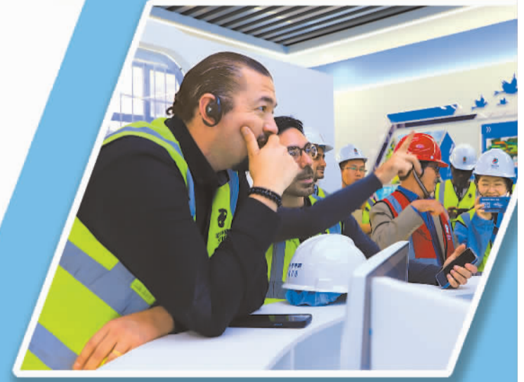
▲在江西新余，外媒记者参观新余市综合智慧零碳电厂展厅。