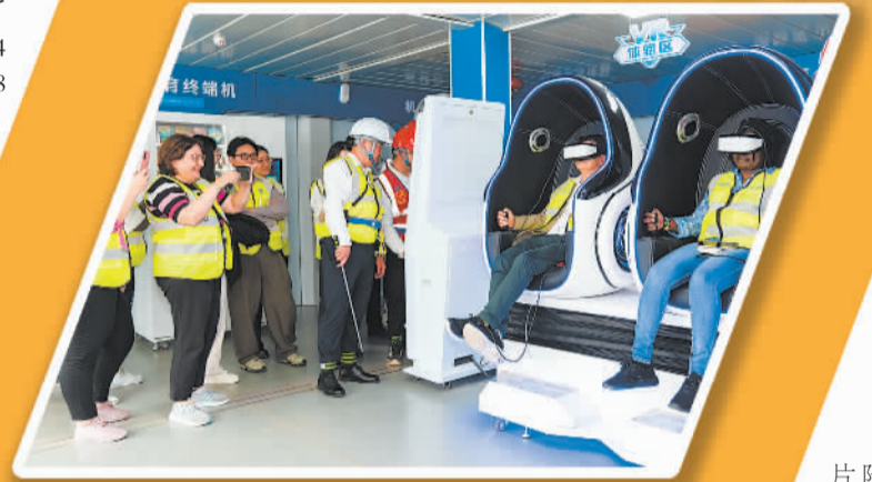
▲在湖南长沙黄花国际机场T3航站楼项目新型智慧安全体验中心，外媒记者通过虚拟现实技术体验安全防护场景。