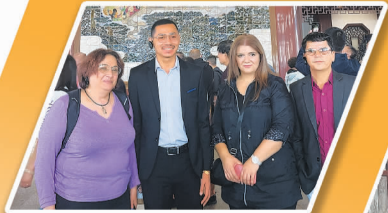
▲外媒记者在湖北武汉黄鹤楼合影留念。