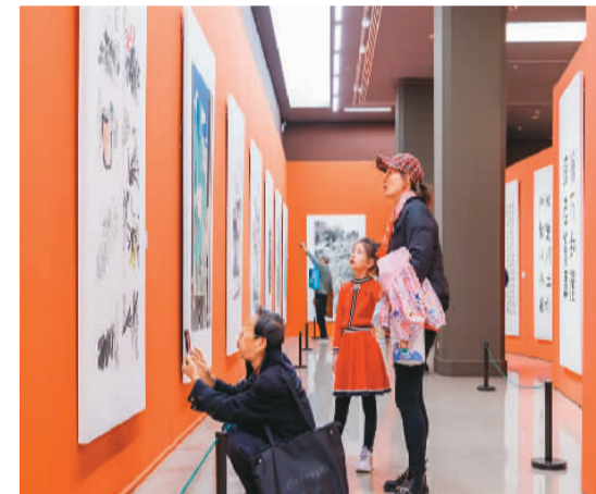
▲ 浦江书画作品晋京展现场

本次展览为2023浦江·第十六届中国书画节系列展览之一。与此同时，2023浦江·第十六届中国书画节开幕式暨“万年浦江”2023·全国中国画作品展览、“翰墨清风”2023全国清廉书法作品大展在浦江开展。