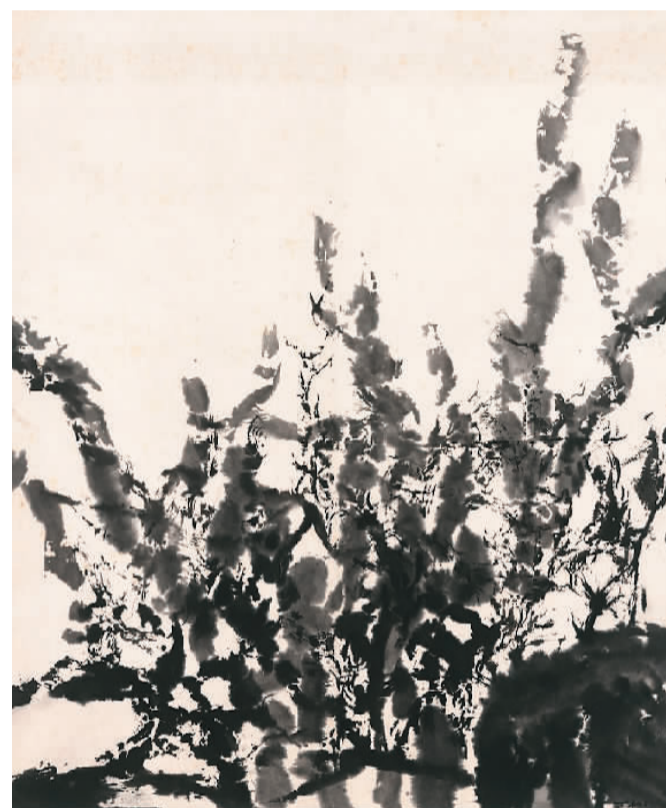
▲ 无题 (中国画) 赵无极作 中国美术学院美术馆藏

统”的角度，梳理赵无极早年以及到法国十年间的画作。赵无极出生书香世家，童年接受了良好的中国传统文化教育和书法启蒙。1935年，他人读国立杭州艺专，接受西画和中国画教育，尤其受到印象派及塞尚、马蒂斯、毕加索等西方现代绘画的影响。1951年，受保罗·克利作品的启发，他顿悟中华优秀传统文化的创造性，以青铜器铭文和甲骨文等为基本视觉符号，进行异变，创造形体和空间。