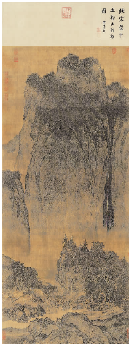
▲ 溪山行旅图轴 (中国画) 范宽(北宋)作