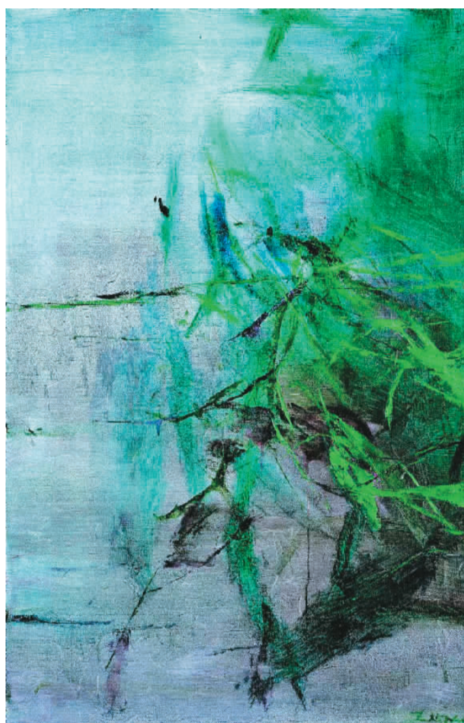
▲ 18.03.2008 (油画) 赵无极作