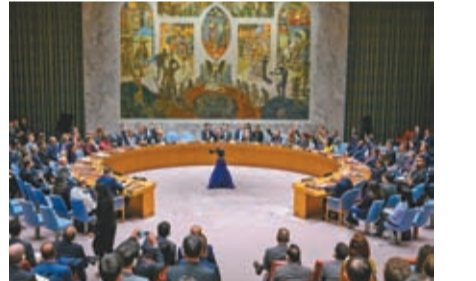
◆聯合國安理會就巴以局勢通過決議。資料圖片