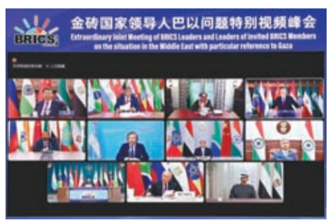
▲11月21日晚，中國國家主席習近平出席金磚國家領導人巴以問題特別視頻峰會並發表題為《推動停火止戰 實現持久和平安全》的重要講話。

習近平指出，本次峰會是金磚成員後的首場領導人會晤。當前形勢下，金磚國家就巴以問題發出正義之聲、和平之聲，非常及時、非常必要。加沙地區的衝突已持續一個多月，造成大量平民傷亡和人道主義災難，並出現擴大外溢趨勢，中方深表關切。當務之急，一是衝突各方要立即停火止戰，停止一切針對平民的暴力和襲擊，釋放被扣押平民，避免更為嚴重的生靈塗炭。二是要保障人道主義救援通道安全暢通，向加沙民眾提供更多人道主義援助，停止強制遷移、斷水斷電斷油等針對加沙民眾的集體懲罰。三是國際社會要拿出實際舉措，防止衝突擴大、影響整個中東地區穩定。各方應該將聯合國大會和安理會有關決議要求落到實處。