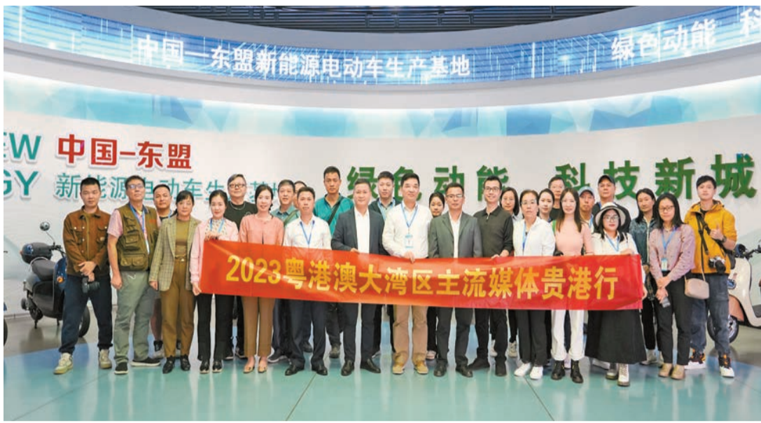
粵港澳大灣區主流媒體採訪團合影留念。

【香港商報訊】由廣西貴港市委宣傳部聯合香港商報共同舉辦的「港灣聯動 共享發展新機遇」——2023年粵港澳大灣區主流媒體貴港行活動日前啓動。來自香港大公文匯傳媒集團、香港商報、香港經濟導報、澳門商報、大灣區時報，以及深圳特區報、深圳商報、深圳晚報、晶報、深圳新聞網、寶安日報、江門日報、惠州日報、東莞電視台、惠州廣播電視台、新浪網廣東頻道等17家粵港澳大灣區主流媒體和多位網絡達人參與。