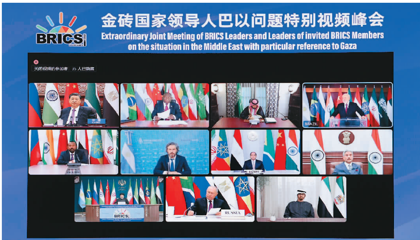
11月21日晚,国家主席习近平出席金砖国家领导人巴以问题特别视频峰会并发表题为《推动停火止战 实现持久和平安全》的重要讲话。

新华社北京11月21日电 11月21日晚,国家主席习近平出席金砖国家领导人巴以问题特别视频峰会并发表题为《推动停火止战 实现持久和平安全》的重要讲话。(讲话全文见第二版)