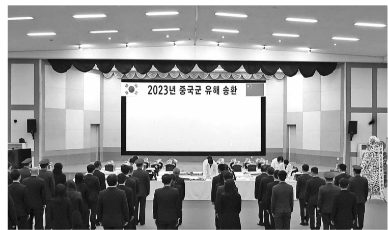
11月22日,在韩国仁川,韩方工作人员将志愿军烈士遗骸入殓。11月22日上午,中韩双方在韩国仁川“中国人民志愿军烈士遗骸临时安置所”共同举行第十批志愿军烈士遗骸装殓仪式。

11月22日上午,中韩双方在韩国仁川“中国人民志愿军烈士遗骸临时安置所”共同举行第十批志愿军烈士遗骸装殓仪式。中国退役军人事务部副部长常正国率中方交接代表团全体人员、中国驻韩国