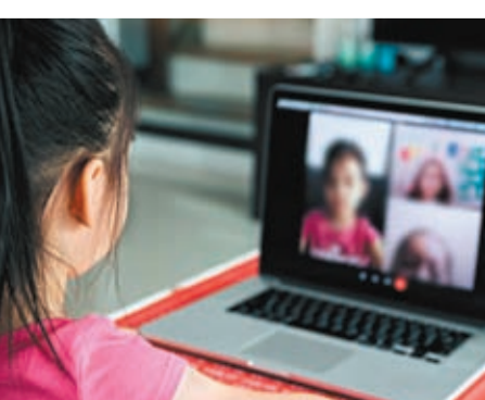
◆三年疫情期間，學生多上網課，學習進度大打折扣。資料圖片

香港教育局發言人指疫情停課影響學生學習，而香港TSA數據與國際大型評估反映情況相若。局方呼籲學校和家長不要只著眼評估結果，更應理解整體達標率下跌背後各種原因，給予學生空間重新適應校園生活與節奏。