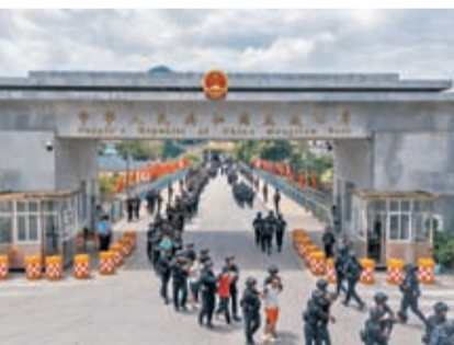
◆雲南公安機關9月與緬甸相關地方執法單位進行聯合行動，成功逮捕一批犯罪嫌疑人。網上圖片

11月18日，德宏公安機關邊境警務執法合作取得重要突破，緬北木姐地執法部門將571名電信網絡詐騙犯罪嫌疑人陸續移交中方，對詐騙分子形成強大震懾。截至目前，在緬甸各方的大力配合下，累計3.1萬名電信網絡詐騙犯罪嫌疑人移交中方，並被涉案地公安機關陸續押回。公安機關將徹查其全部違法犯罪事實，堅決依法予以嚴懲。