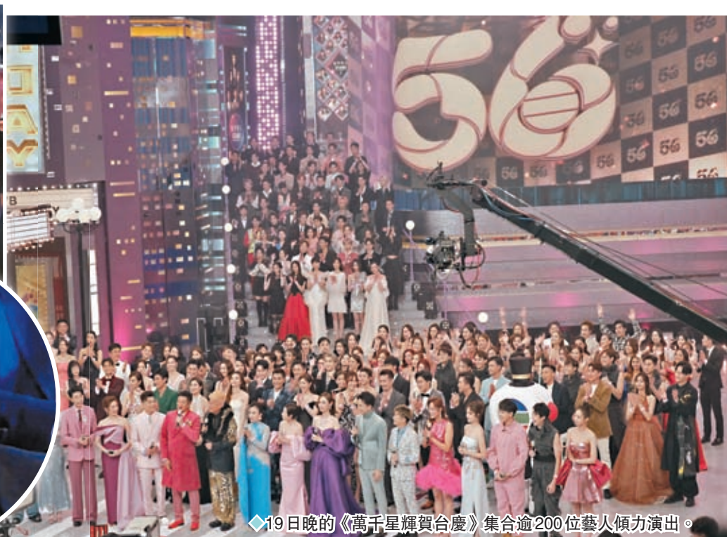
◆19日晚的《萬千星輝賀台慶》集合逾200位藝人傾力演出。