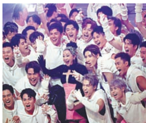
◆家燕姐與半百男藝人合作演出。