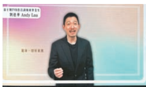
◆劉德華拍片鼓勵TVB藝人。