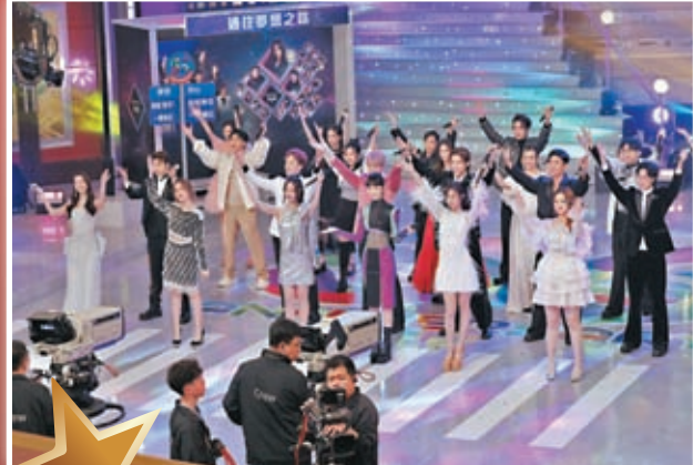
◆炎明熹率《聲夢》歌手演出「聲sing夢裏人」。