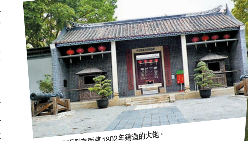
◆衙門前庭兩側有兩尊1802年鑄造的大炮。