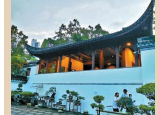
◆公園內的嶺南盆景造型獨特。