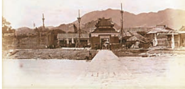
◆1898年的九龍寨城，圖中央為接官亭，亭前通道連接的龍津石橋延伸出海。