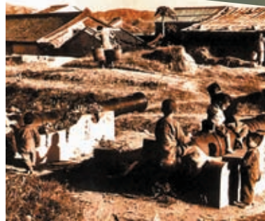
◆九龍寨城早期居民的生活狀況。

署曾派5位建築師前往內地實地考察、學習。公園設計還曾於1993年，在國際園藝博覽會中榮獲「設計優異獎」。