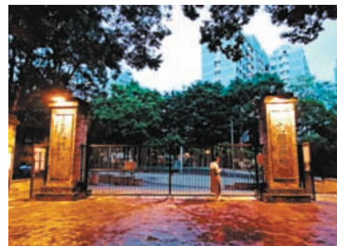
◆九龍寨城公園的東正門

公園項目於1994年動工，1995年8月啟用，耗資6,700萬港元。建設團隊將優美如畫的「小橋流水、亭台樓閣」遷入公園。為選擇最合適的設計，建築