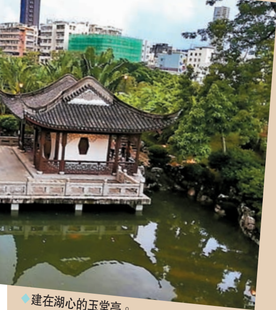
◆建在湖心的玉堂亭。