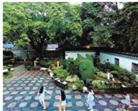
◆寨城公園也有年輕遊人來參觀拍照，但不是大多遊客知道。

經過多個世紀，九龍寨城雷雨交加的過去終於成為歷史的篇章，換來如今生意盎然、百花爭艷的九龍寨城公園。這片怡人的休憩區，在喧鬧的城市中展示着自己的蔥蘢與古樸。肅穆的古蹟與淡雅的江南融合在一起，在微風中向來往的人們悠然講述着「那年」與「今日」。