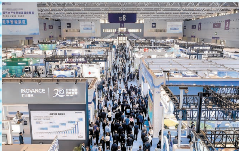
第二屆全國節水產業創新發展成果展，超過250家國內外企業參展。

第二屆全國節水產業創新發展大會由全國節約用水辦公室、廣東省水利廳、深圳市政府共同舉辦。大會上，多位專家學者分享新案例新理念，為現代化的節水產業凝聚發展共識。大會發布了國家節水行動階段成果、典型地區再生水利用配置試點中期評估成果、《國家成熟適用節水技術推廣目錄(2023)》和《國家鼓勵的工業節水工藝、技術和裝備目錄(2023年)》等節水新成果，舉行現場簽約儀式，促成12個項目成功簽約，簽約金額達116億元人民幣。特邀演講嘉賓，國家有關部委司局、水利部機關直屬有關單位、全國各省區市水利部門和廣東省直、各地市相關負責人等近300嘉賓參加大會。