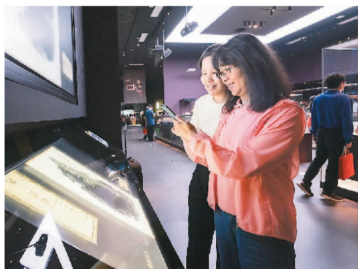
两位观众在中国考古博物馆内的「甲骨互动体验区」参与体验活动。

2008年夏天，近2500枚珍贵竹简被小心翼翼地运送至清华园，经测定，简的年代在战国中晚期。如今，在清华简入藏之地举办这场国际对话，更有别样意义：岁月长轴缓缓铺展，十余年的