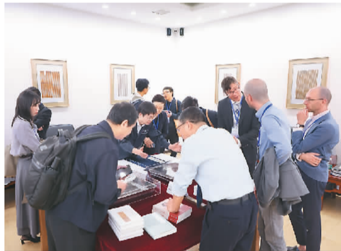
参加「古文字与中华文明」国际学术论坛的专家学者在参观清华简。