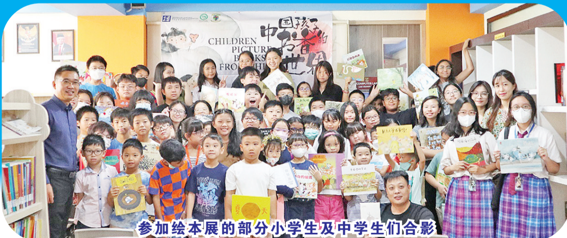
参加绘本展的部分小学生及中学生们合影