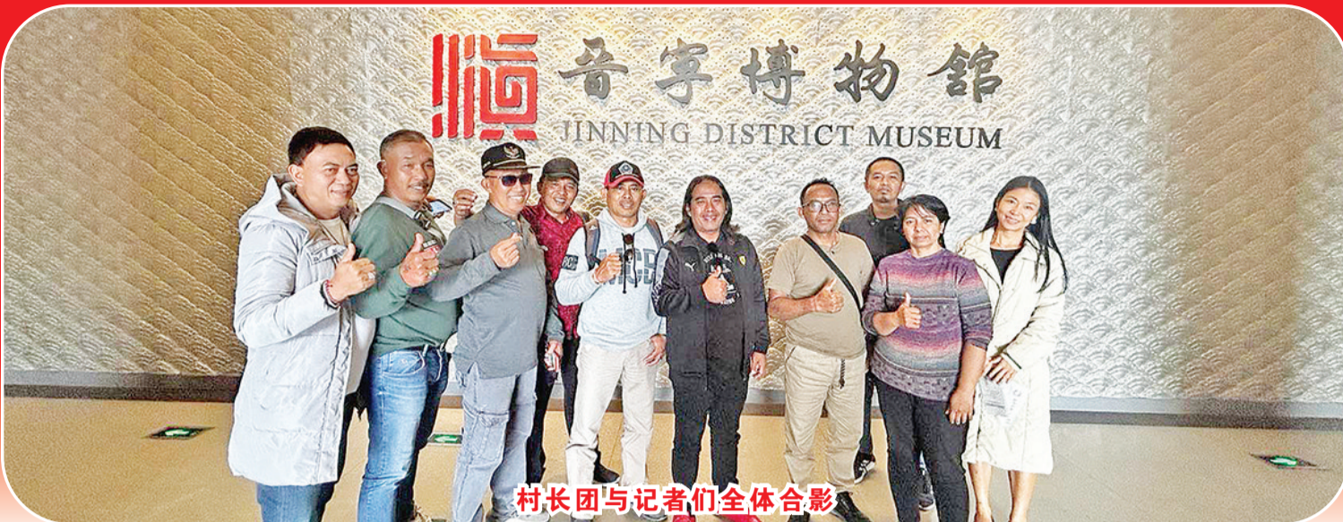
村长团与记者们全体合影