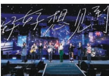
◆五月天上海開唱，告五人擔任嘉賓。

五月天演唱了《盛夏光年》、《戀愛ING》、《派對動物》、《因為你所以我》、《突然好想你》、《為你寫下這首情歌》等經典歌曲。唱到《擁抱》時，主唱阿信對歌迷說：「別走，別走。請大家放心，五月天暫時不會走，你們要趕也趕不走。」從在上海8千人的舞台唱到8萬人的體育場，阿信表示：「不管現場有多少人來，有時我們說朋友不嫌多，只要有一兩個就夠了，有你們真心『知足』了。」告五人也驚喜