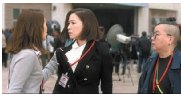
◆《新聞女王》集眾多好戲之人，被指是「演技保證」。

至於劇集片尾曲MV還曝光了劇集的星級客串陣容，當中最大驚喜的是陳山聰，見他痛苦地揮刀，手中還持有一個洋娃娃，似乎飾演非一般的角色，令人期待。