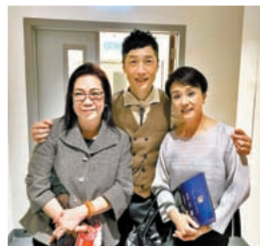
◆粵劇名伶蓋鳴暉(右)亦有捧場。

香港文匯報訊「馬浚偉《幸福·春夏秋冬》Ma's Ter Mic 演唱會2023」於11月10日起演出6場。馬浚偉這次突破演唱會的藝術作品，給予極高評價。馬浚偉衷心感謝一眾政商界及演藝界的好友們，多謝大家蒞臨支持。首三場演出已順利舉行，17日晚展開最後三場，已經開始不捨，並揚言：「這一切的成功離不開大家的鼎力支持與團隊協助。」