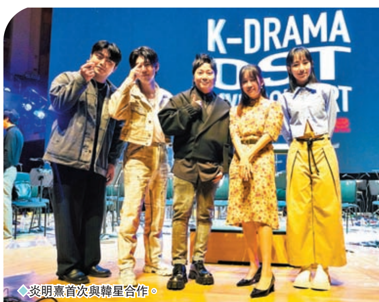
◆炎明熹首次與韓星合作。