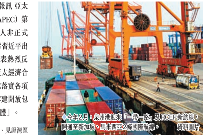
今年2月，泉州迎來「一帶一路」及RCEP新航線，開通至新加坡、馬來西亞2條國際航線。

APEC秘書處執行主任瑪利亞表示，中國近年始終堅持可持續發展，在生態環境保護、可持續產業發展、推進新能源領域研究等方面，都為亞太地區作出積極貢獻，「我們相信中方以實際行動，兌現了各項國際承諾，期待未來還能看見更多成果。」