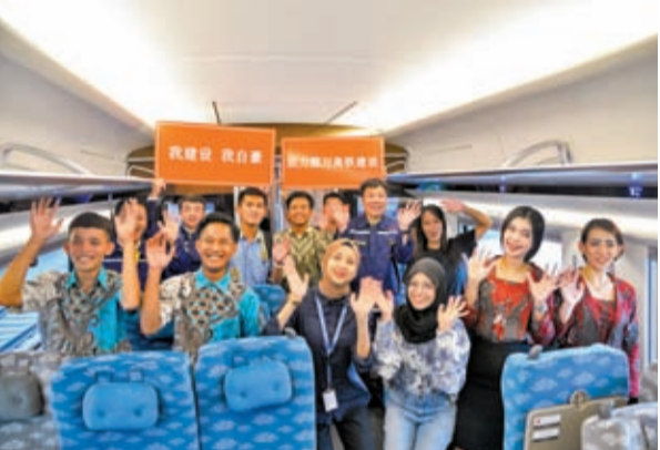
亞太經濟體相互依存、發展迅速，是打造合作共贏的亞太夥伴關係成果。圖為印尼的「一帶一路」項目雅萬高鐵。資料圖片