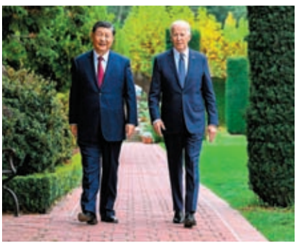
當地時間11月15日，中國國家主席習近平同美國總統拜登在麥利莊園舉行中美元首會晤。

王毅最後說，此訪是習近平外交思想的又一次成功實踐，是習近平主席運籌大國關係的「大手