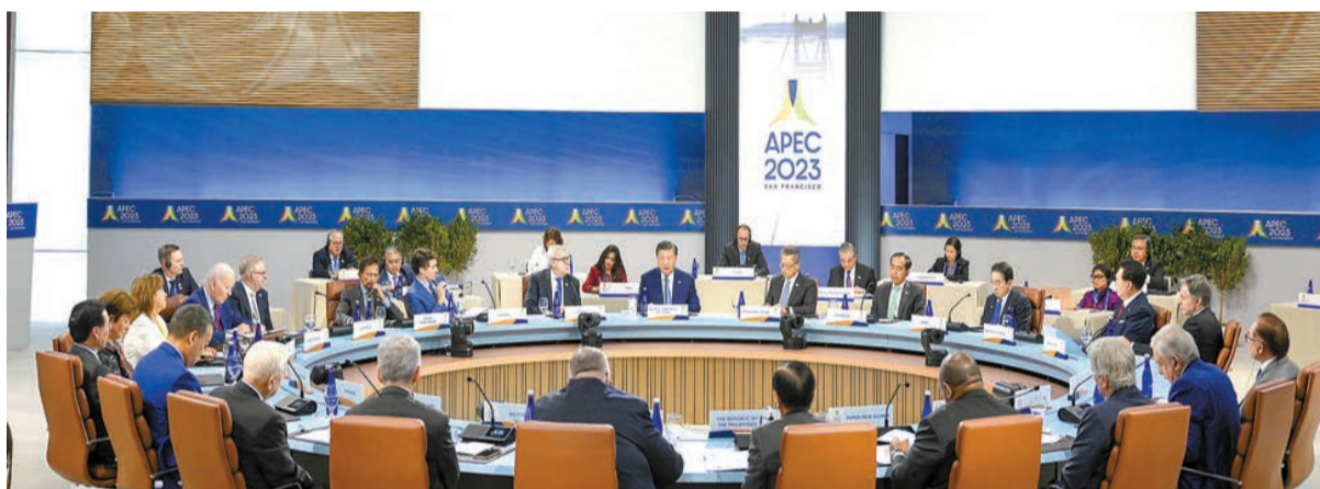
當地時間11月17日上午，亞太經合組織第三十次領導人非正式會議在美國舊金山莫斯科尼中心舉行。