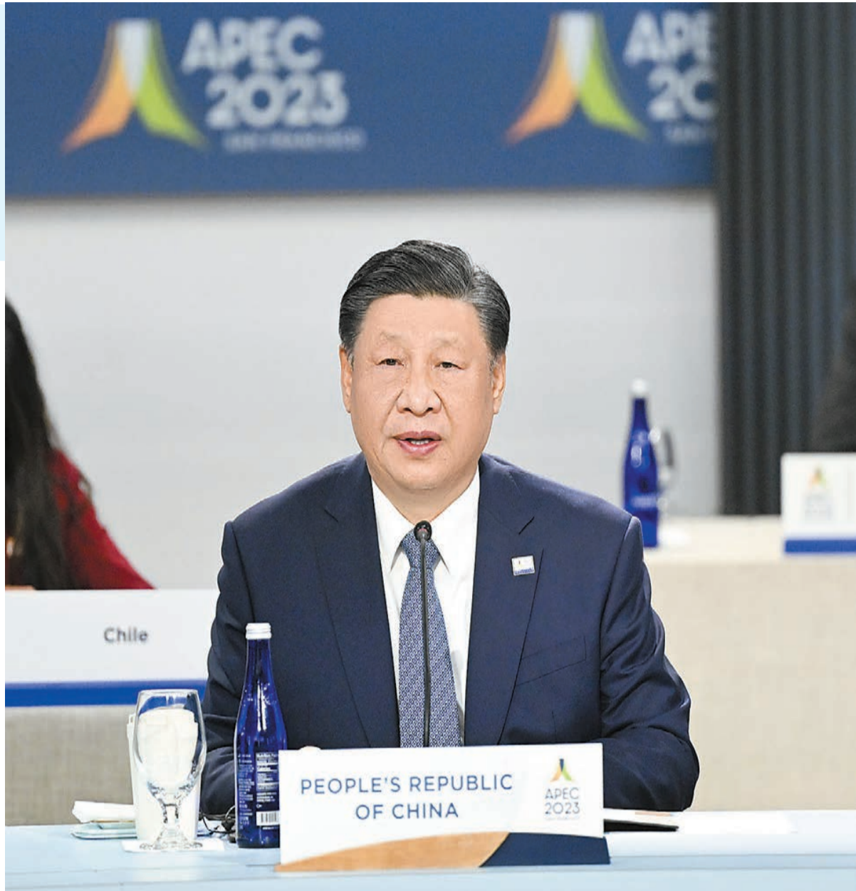
習近平出席亞太經合組織第三十次領導人非正式會議並發表重要講話。