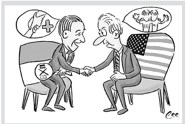
漫点南洋 停火 作者: Lee

美中会议启新篇，搏弈双雄祸害添。空口无凭书状语，言行相顾一丝牵。互尊对等修成果，世界和平愿景连。自保疆田兴国盛，那忧一马当先牵。