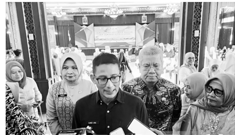
中小微业产品可进入国际市场

费尔南德斯补充说,美国已经与13个国家和欧盟,建立了矿产安全伙伴关系,并在全球支持了4个项目,因此他提出了两项建议,即在环境和其他方面提供技术援助,并协助推动美国私企在印尼进行投资。