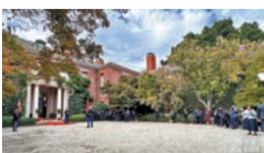
◆會晤開始前的斐洛里莊園。

當地時間15日晚，習近平主席在舊金山出席美國友好團體聯合舉行的歡迎宴會並發表演講。出席當晚歡迎宴會的美國友人中，