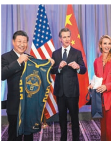
◆加州州長紐森向習近平贈送金州勇士隊球衣。