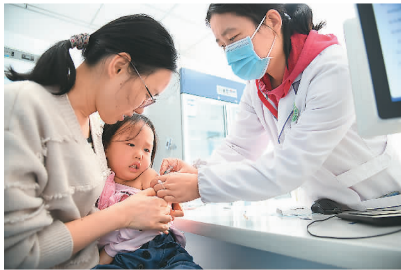
近日,在安徽合肥市蜀山区小庙镇中心卫生院,医务人员为孩子接种流感疫苗。

怎样甄别不同的呼吸道疾病?肺炎支原体感染是一种怎样的疾病?公众尤其是“一老一小”应如何科学应对?针对公众热点关切,多位专家进行了解答。