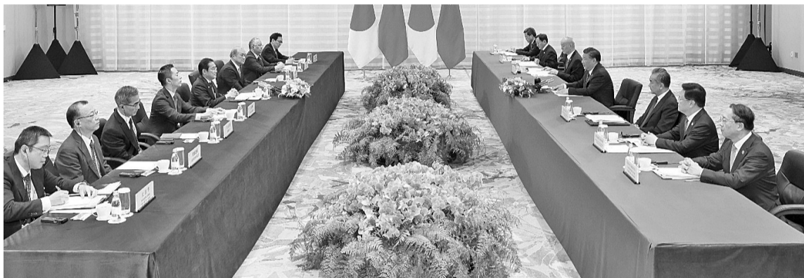
当地时间11月16日下午,中国国家主席习近平在旧金山会见日本首相岸田文雄。

新华社旧金山11月16日电 当地时间11月16日下午,中国国家主席习近平在旧金山会见日本首相岸田文雄。