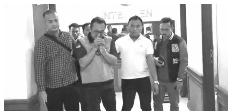
被停职查办的受贿嫌疑人HS。