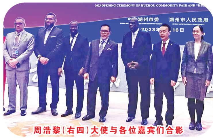
周浩黎(右四)大使与各位嘉宾们合影

迈出具体合作的重要一步。此外，还在北苏门答腊建立了一个名为“草药园艺科技园”的中国中心。我相信，此次合作将有助于实现印尼利用天然有机材料发展化妆品行业的愿景。我也深信印尼和中国在化妆品行业合作中能够进一步