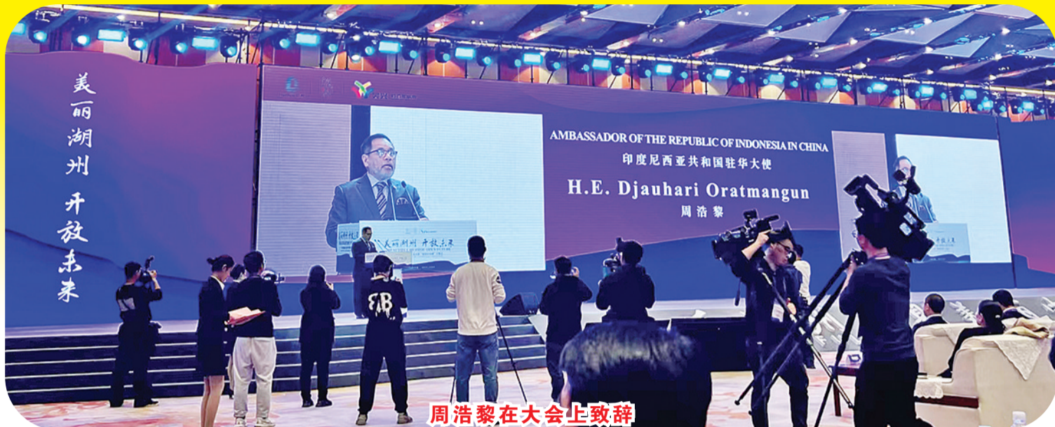
周浩黎在大会上致辞

【本报讯】11月16日，印尼驻华大使周浩黎（Djauhari Oratmangun）出席由中共湖州市委、湖州市人民政府主办的2023湖州商品博览会暨“湖州开放周”——第七届中国国际化妆品行业领袖大会，其以“品质引领发展，美丽共创未来”为主题。以下为周浩黎大使的致辞：