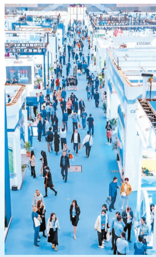
本屆成果展位於深圳國際會展中心（寶安）8號館。

11月16日，由全國節水辦、廣東省水利廳、深圳市政府共同舉辦的第二屆全國節水產業創新發展大會也將在深圳國際會展中心（寶安）舉行，大會以「節水優先、產業驅動、綠色發展」為主題，旨在加強前瞻性引領性實踐探索，深化「政產學研用」綜合服務交流，通過「以會帶展，以展促會」，暢通政企常態化溝通渠道，推動市場供需兩端有效銜接，培育發展節水產業，助推經濟社會發展全面綠色轉型。 大會按照「五新五有」主線進行總體設計，即圍繞把握節水新理念、探討節水新實踐、調研節水新成果新示範、搭建節水產業新平台、加速推廣節水新成效等五部分，設置以「新理念，有主題」「新實踐，有創新」「新示範，有特色」「新產業，有龍頭」和「新積澱，有成效」的五大板塊，分別覆蓋全體會議、專題會議、範例考察、產業展會和大會成果等環節。