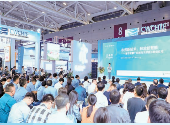
智慧水務技術產品發布會。

在創新專精展區，有無人機、無人船、管道機器人等專精特新企業以及智能建造類企業，展示包括海綿城市技術和雨水回用系統技術、新型納米複合重金屬吸附劑材料、基質淤泥水處理系統在內各節水產業鏈條上的前沿理念、技術及工程應用；在產品裝備展區，展出支撐農業節水增效、工業節水減排、城鎮節水控漏和非常規水源開發利用的成套產品及裝備；在數字智能展區，有涉及數字底座水資源管理、雲腦水系統管控、衛星紅外探漏等的軟件算法平台及智能硬件展出；在範例成果展區，展出農業、工業、城鎮生活和非常