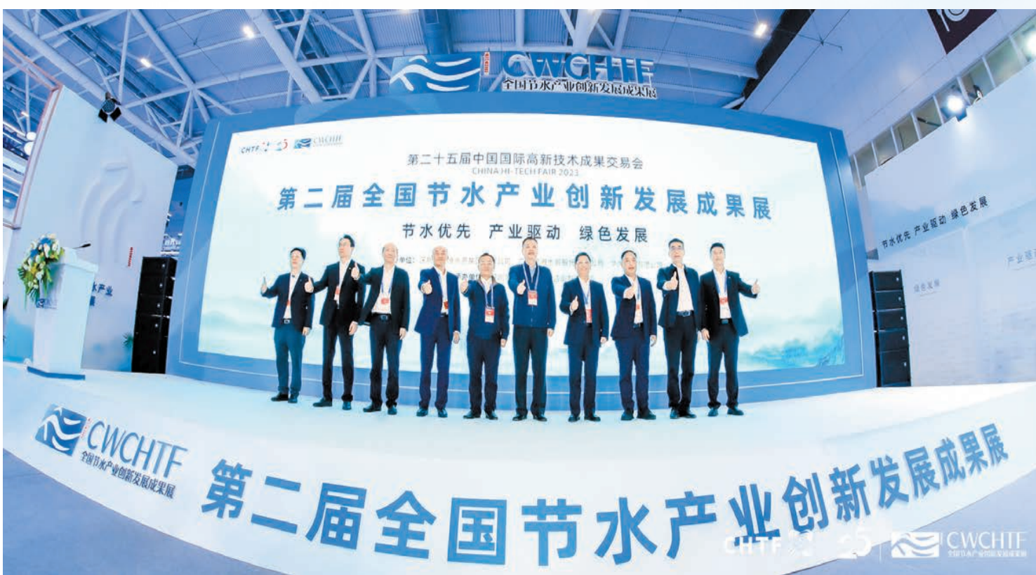
第二屆全國節水產業創新發展成果展在深圳開展。

11月15日，第二屆全國節水產業創新發展成果展在深圳國際會展中心（寶安）開展，展期三天。節水領域產品裝備製造、水務運營、第三方服務等254家國內外企業參展，全方位展現節水產業發展的新趨勢新機遇。全國節約用水辦公室、廣東省水利廳、深圳市人民政府相關負責人出席開幕式並致辭。 余麗齡 圖片由深圳市水務局提供