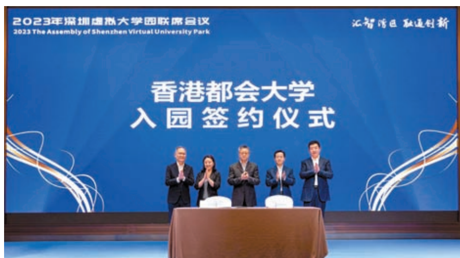
▲香港都會大學簽約入園儀式現場。