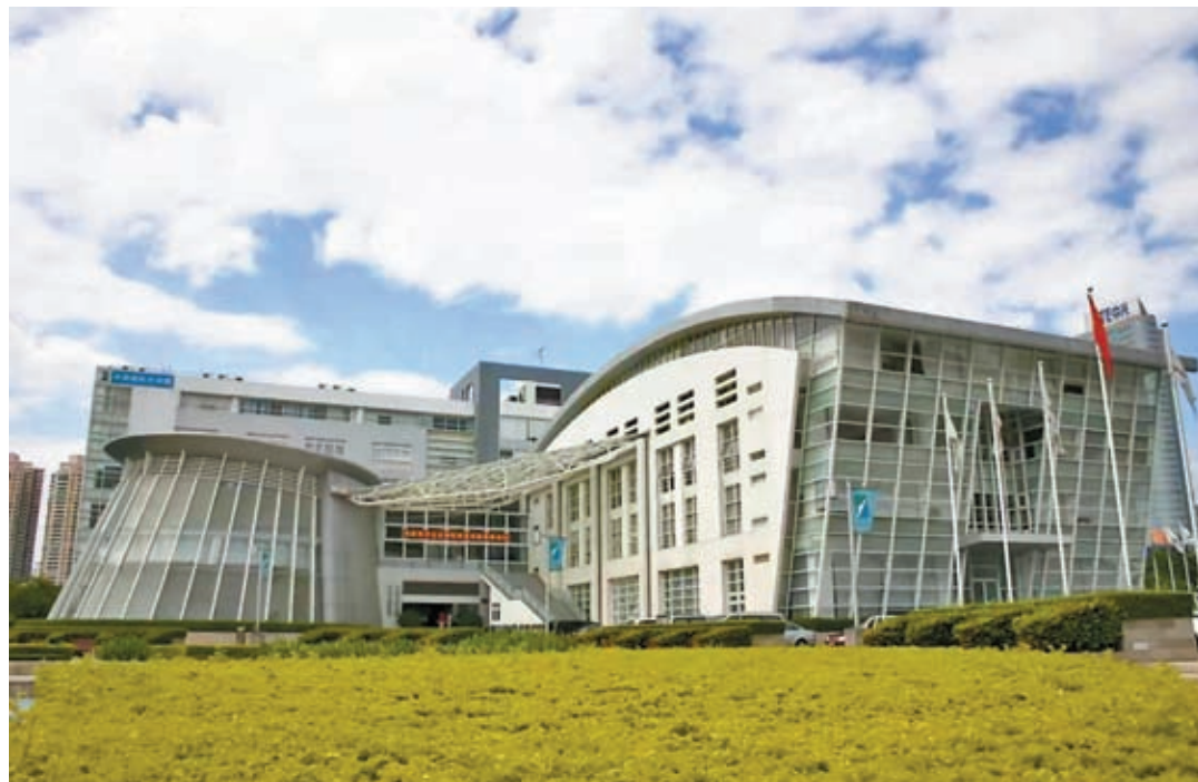
▲深圳虛擬大學園外觀。

此外，還將加強知識產權保護，優化人才激勵機制，加大生活配套服務，為深港兩地加強技術合作、聯手創新創業鋪路搭橋。