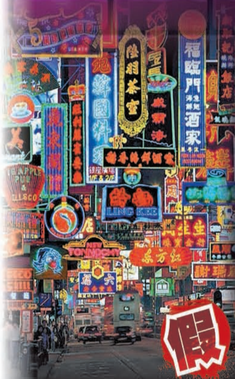
網上另一張流傳的照片，是車流在五光十色的霓虹招牌下穿梭，其實這幅作品是由英國攝影師將香港各地的多張霓虹招牌照片拼接後製作而成。