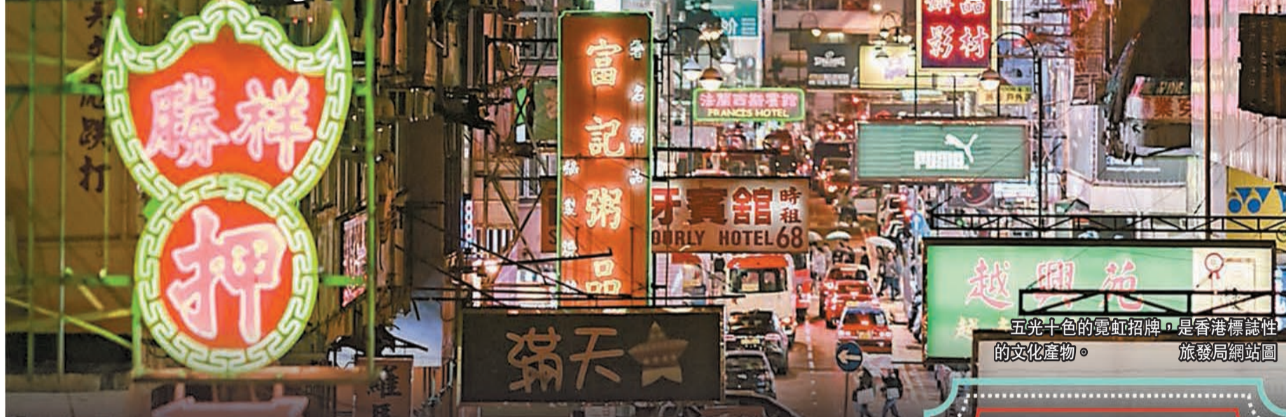
五光十色的霓虹招牌，是香港標誌性的文化產物。

【香港商報訊】記者周偉立、林駿強報導：霓虹招牌是香港標誌性的文化產物，為了保障樓宇安全，屋宇署引進招牌監管制度，對危險及違例招牌發出法定清拆命令。昨日，有內地網民在社交媒體發文聲稱香港引入「內地城管辦法」，將霓虹招牌統統拆掉，並配上多個霓虹招牌被裝上貨車運走的圖片，隨即引起網民熱議。不過，經查證後發現，網民發布的圖片，有部分經後期（P圖）處理，並非真實照片。事實上，小型招牌（含霓虹招牌）只要符合相關安全要求，是可以繼續使用的。屋宇署發言人回應本報查詢時亦強調，署方並沒有針對霓虹燈招牌的大規模執法行動。