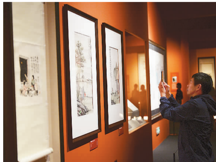
“百年巨匠 百年史诗——百位大师风采特展”现场。

本报（记者邹雅婷）“百年巨匠 百年史诗——百位大师风采特展”自9月28日在中国国家博物馆开展以来，受到社会各界高度评价，引起观众热烈反响，主办方决定将展览延期至11月30日。