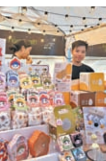
◆ 星光夜市中的不少攤檔都會售賣具本地特色的商品。