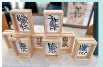
◆ 鳴羽的攤檔既推廣書法班，也售賣精美作品。