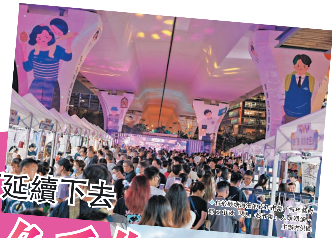
◆位於觀塘海濱的夜市市集「青年藝術節X中秋「觀」光市集」人頭湧湧。