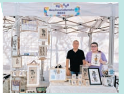
◆「鳴羽書法班」的攤檔為夜市增添傳統文化氣息。