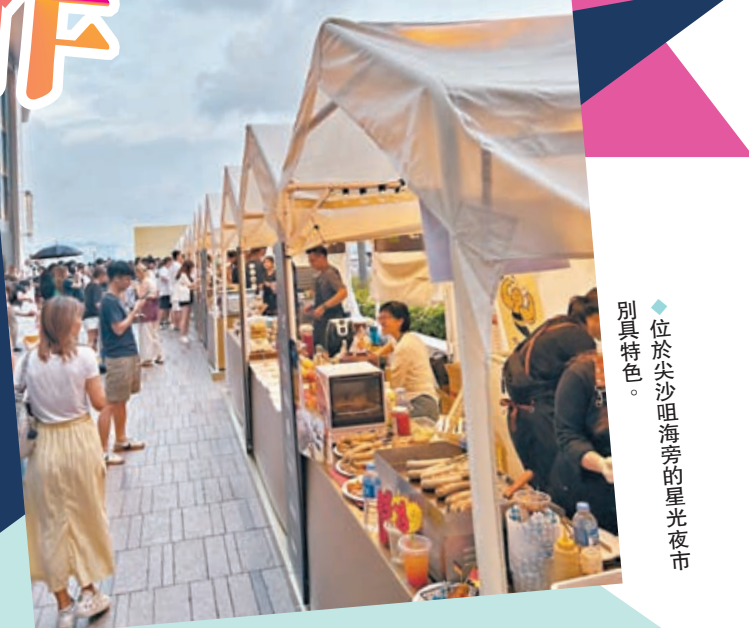
◆位於尖沙咀海秀的星光夜市別具特色。

拍攝香港的人總不會錯過香港的夜色，疫情前的香港有種來日方長的不知疲倦，升騰的萬家煙火與華麗都市的霓虹鼎立，交錯出一幅民間浮世繪。