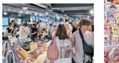
◆ D2 Place 長期經營室內主題的市集，有攤主表示對夜市較有興趣。

她又表示，香港的消費模式其實已經相對成型，比如，如果在路邊買小吃，大家可能會去旺角周邊，想買什麼都會有固定的地方，她對於夜市的未來，認為需要較大轉變和調整才可更好地發展。