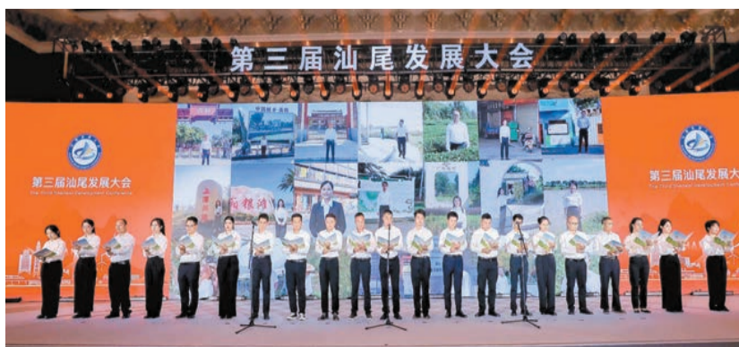
農村職業經理人集體宣讀倡議書《富民興村路，我是踐行者》。

總過夜遊客1697萬人次，遊客總數2874萬人次。 富民增收產業遍地開花，汕尾鑄定農產品加工業和食品工業為主攻方向，打造甘薯、絲苗米、水產預製菜等產業集群，讓農民更多分享產業增值收益。 既有「含金量」又有「含綠量」。豐富的森林資源是汕尾的綠美家當。今年以來，汕尾匯集社會力量，形成推動綠美建設的強大合力。在綠美汕尾生態建設認捐認種儀式上，汕尾市副市長曾宏武為認捐認種價值前12名的企業和熱心人士代表頒發牌匾。 「微信掃一掃，就可以捐款種樹。」在主持人的指引下，與會嘉賓紛紛拿出手機，掃碼進入「愛汕尾·我助綠」小程序認捐認種，持續掀起全民愛綠、植綠、護綠的熱潮。