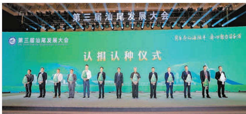
46個植樹點（片、區）認捐認種儀式。