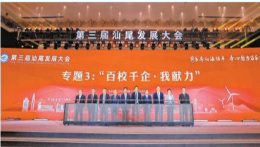
名校大院科技賦能汕尾「百千萬工程」高質量發展。

澎湃」「你我合力，讓老區城鄉面貌更加靚麗」「你我聚力，讓老區人民生活更加美好」……邊峰發出在奮進「百千萬工程」這場追逐賽、實力賽和團隊賽中實現「雙向奔赴、共贏未來」的號召，引起與會嘉賓的共鳴與熱議。 汕尾市委副書記、市長鄭海濤化身「推介官」，從「強縣、興鎮、富村」的汕尾發展打法，承東接西、聯通內外的汕尾交通優勢，新能源汽車、海上風電裝備製造、新一代電子信息、石化新材料、美妝珠寶、海洋牧場、食品加工、文旅康養等汕尾強勢產業，以及市場化、法治化、國際化的汕尾營商環境等，全方位向與會嘉賓集中展現汕尾強力推進「百千萬工程」，奮力開創城鄉區域協調發展新局面的生動實踐，並向廣大鄉賢、企業家、各界精英翹楚們發出了「攜手奔向海陸豐，齊心聚力『百千萬』」的熱誠邀約。 廣東省委改革辦副主任、省「百千萬工程」指揮部辦公室專職副主任陳德忠指出，汕尾牢牢把握廣東省委實施「百千萬工程」重大機遇，聚焦「眼睛要亮、筋骨要壯、腰包要鼓、腦袋要富」，創新打出「大擂台、大拉練、大賽場、大培訓、大宣講、大評比」等系列組合拳，探索「1249」模式發動社會力量助力「百千萬工程」，為全省實施「百千萬工程」提供了成功經驗和鮮活案例，希望汕尾鑄定「爭當粵東西北示範，走在全省前列」的定位目標，以前瞻視角和系統思維推進汕尾「百千萬工程」各項工作，不斷在「百千萬工程」賽道上超越跨越、爭先領先，在全省豎起工作標杆、打造示範引領樣板。