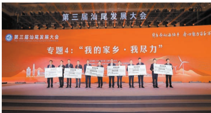
認捐130個民生公益項目，價值共計約1.34億元。