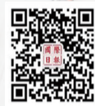
掃一掃，更多精彩新聞與你分享