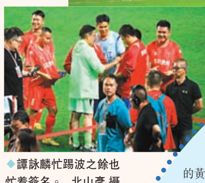
譚詠麟忙踢波之餘也忙着簽名。

「香港明星足球隊×貴州榕江村超聯隊足球邀請賽2023」比賽猶如嘉年華會，氣氛熱鬧，「村超」開心足球文化傳到香江！這場不一樣的足球比賽分3節進行，每節休息時有表演，主辦單位邀請了貴州表演團體以及本地的爵士芭蕾舞學院的學生作開場表演，掀起比賽序幕，前者表演了民族舞蹈，後者則出動了過百位學員為球隊加油打氣，表演舞蹈包括《Ole Ole Ole》及《Hokey Pokey》，之後更有武術表演，逾20位學員由兩位馬來西亞國家級教練的帶領下，進行中國武術表演，宏揚中華文化。同場來自貴州省榕江縣的表演隊，則來自不同民族與背景，他們表演了民族舞和獻唱歌曲《歡迎你到榕江來》等。