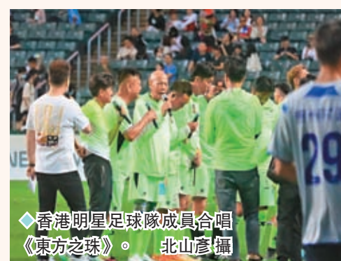
香港明星足球隊成員合唱《東方之珠》。