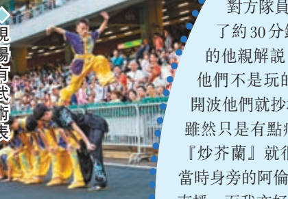
現場有武術表演，相當精彩。

上乳豬一隻，盡顯友誼第一。晚上筵開10多席慶功。阿叻接受傳媒訪問時，直言賽果是意料之外，因對方隊員平均20多歲，最初的15分鐘由對方領先，但並非對方讓賽，事關落到場就人人都「搏晒命」，可能其後對方擺了個「烏龍」洩了氣，反令明星隊士氣高漲，而踢波就是憑一股氣的！至於意料之內的就是賽事直播高達過億人次觀看。他又笑謂：「我在13歲的願望，就是在香港大球場這個主場之地捧盃，結果到現在73歲才圓夢，雖然隔了個世紀，都好開心！」說到阿叻在比賽期間一度踢到對方隊員的腳，引起「奸莽」疑雲，他即解釋：「沒有這回事，我們