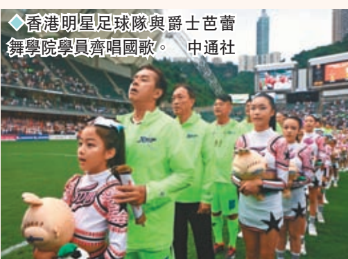
香港明星足球隊與爵士芭蕾舞學院學員齊唱國歌。