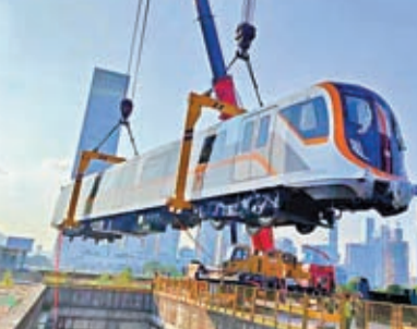
近日，深圳地鐵13號線首列客運車運抵深圳，在內湖停車場完成吊卸。資料圖片

該線路始於深圳灣口岸站，止於上屋站，全長22.45公里，共設有16座車站，全線採用地下敷設方式。13號線一期工程是全自動駕駛創新型線路，採用8輛編組的全自動駕駛地鐵車輛，最高車速每小時100公里。列車採用輕量化鋁合金車體，外觀以白、灰為底色，搭配線路色「亮橙色」貫穿全車腰線，外觀活力感、時尚感十足。在列車內部，控制室與車廂以貫通一體式設計，乘客可以在列車前窗直接觀看地鐵隧道內「光影穿梭」美景。