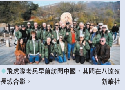
飛虎隊老兵早前訪問中國，其間在八達嶺長城合影。