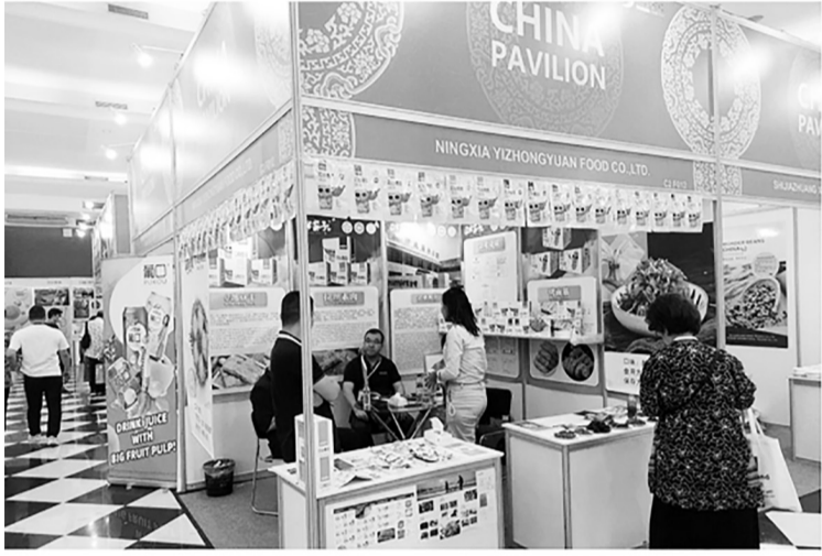
逾百家中国食品企业探索市场商机 逾百家中国食品企业于2023年11月8日至11日期间,在雅加达国际博览会 (JIEXPO) 参展,并探索在印尼市场的商机。

此外,这家建筑业国企还承担了30个国家战略性项目 (PSN), 其中已经完成了10个项目,而另外20个项目仍在施工阶段。 该国企正在进行的国家战略性项目,其中有37%是大坝水库项目,26%是高速公路建设项目,13%是交通设施基础设施 (机场和港口) 项目。其余包括边境口岸项目,工程、采购和施工 (EPC) 合作项目,以及其它基础设施项目。 民房公共公司总经理诺菲尔·阿夏德 (Novel Arsyad) 确认,该公司正在进行的国家战略性项目对满足社会需求和提高印尼竞争力具有重大影响。他表示:“例如,高速公路、机场和港口等项目是能够增加地区之间互联互通,并降低全国物流成本的基础设施。” (Irw)