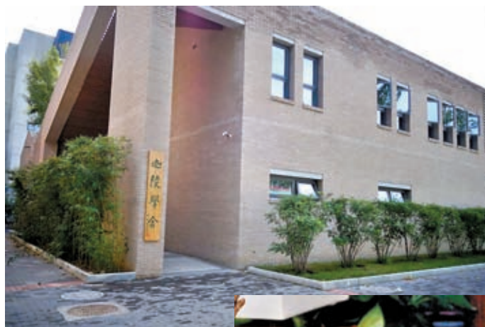
◆葉嘉瑩在南開大學的居所——迎陵學舍。