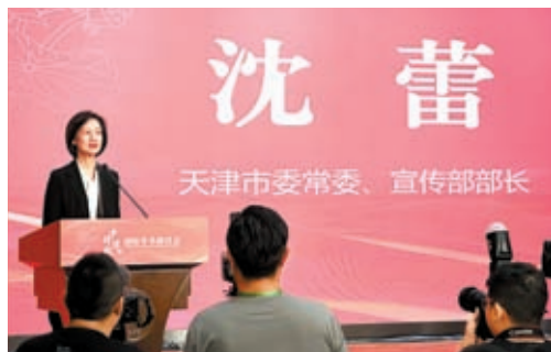
◆天津市委常委、宣傳部部長沈蕾致辭。