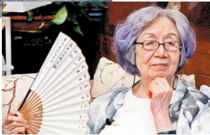
◆葉嘉瑩聽學生誦詩。