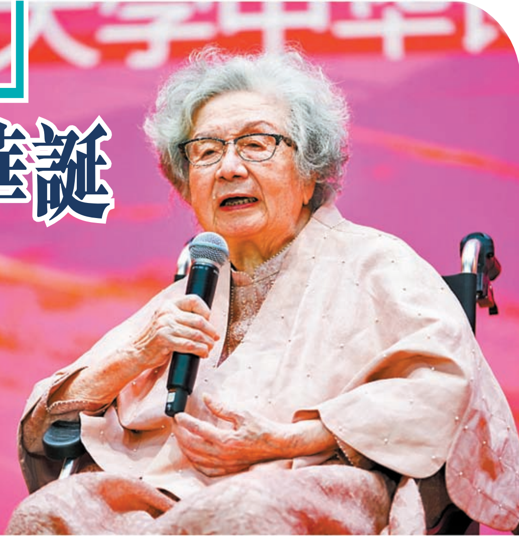
◆著名中國古典詩詞研究專家葉嘉瑩