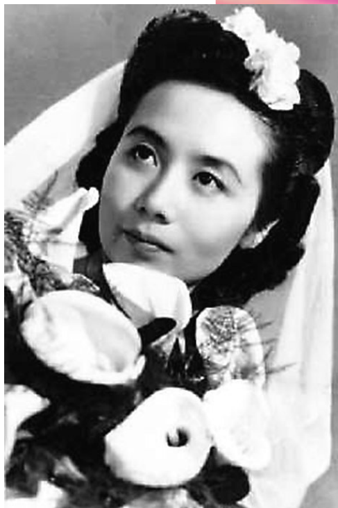
◆葉嘉瑩婚紗照（1948年）

該計劃以葉嘉瑩先生的中華詩教理念為依託，結合南開大學「詩教潤鄉土」行動的探索性成果，着力打造學術研究、詩詞教學、服務學習、社會實踐等合力，以廣續中華文脈，推動中華詩教的當代發展和國際化傳播。