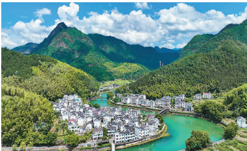
上图：浙江省淳安县下姜村青山相伴、绿水环绕。