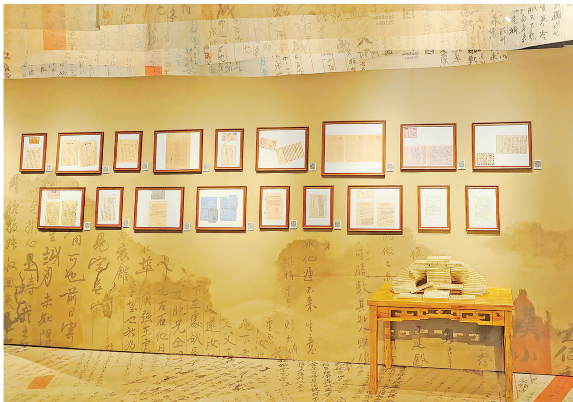
近日，“侨批中的党史——江门侨批活化研究成果展”正在中国华侨历史博物馆展出，图为展出的江门五邑侨批。中新社记者 吴侃 摄

他还寄语中国的青年：“更希望中国青年人人有岳武王之志——爱民、保家、为国之志。”